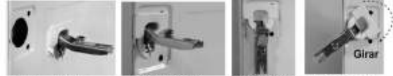
Posicione a dobradiça conforme o desenho acima. Encaixe-a no orifício existente na porta do armário. Em seguida dobre a parte cronada para baixo. Depois gira-a para que esta trave e fique presa à porta.

FIXAÇÃO DOS PUXADORES Encaixe as buchas nos orifícios internos das portas. Encaixe os parafusos nas buchas. Encaixe o puxador no lado externo das portas deixando-se orientar pelos parafusos aparentes. Com o auxílio de uma chave de fenda gire os parafusos até o final de seu curso, cuidando para não apertá-lo em demasia.